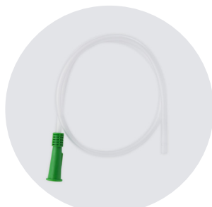
CANNULA STERILE MONOUSO DISPOSABLE STERILE CANNULA