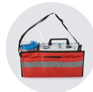
BORSA CON TRACOLLA MINIASPEED PLUS & PRO CARRYING CASE MINIASPEED PLUS & PRO