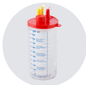
SACCA MONOUSO DA 1000cc DISPOSABLE SUCTION LINER 1000cc