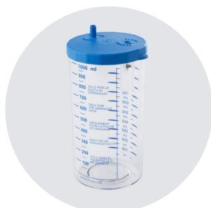
VASO DA 1000cc 1000cc JAR

APPARECCHIO PROFESSIONALE A BATTERIA RICARICABILE E TENSIONE DI RETE, PER USO AMBULATORIALE CON COMPRESSORE A PISTONE PROFESSIONAL ASPIRATOR WITH RECHARGEABLE BATTERY AND MAINS VOLTAGE, FOR AMBULATORY USE WITH PISTON COMPRESSOR