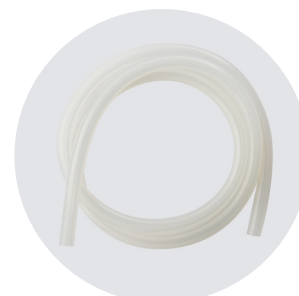
TUBO DI COLL. IN SILICONE CONNECTING SILICONE TUBE