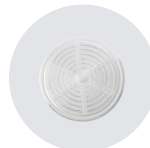
FILTRO ANTIBATTERICO ANTIBACTERIAL FILTER