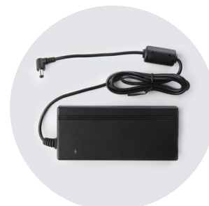
ALIMENTATORE MULTIVOLTAGGIO MULTI-VOLTAGE CHARGER UNIT