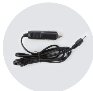
CAVO CON SPINA 12V POWER CORD 12V PLUG